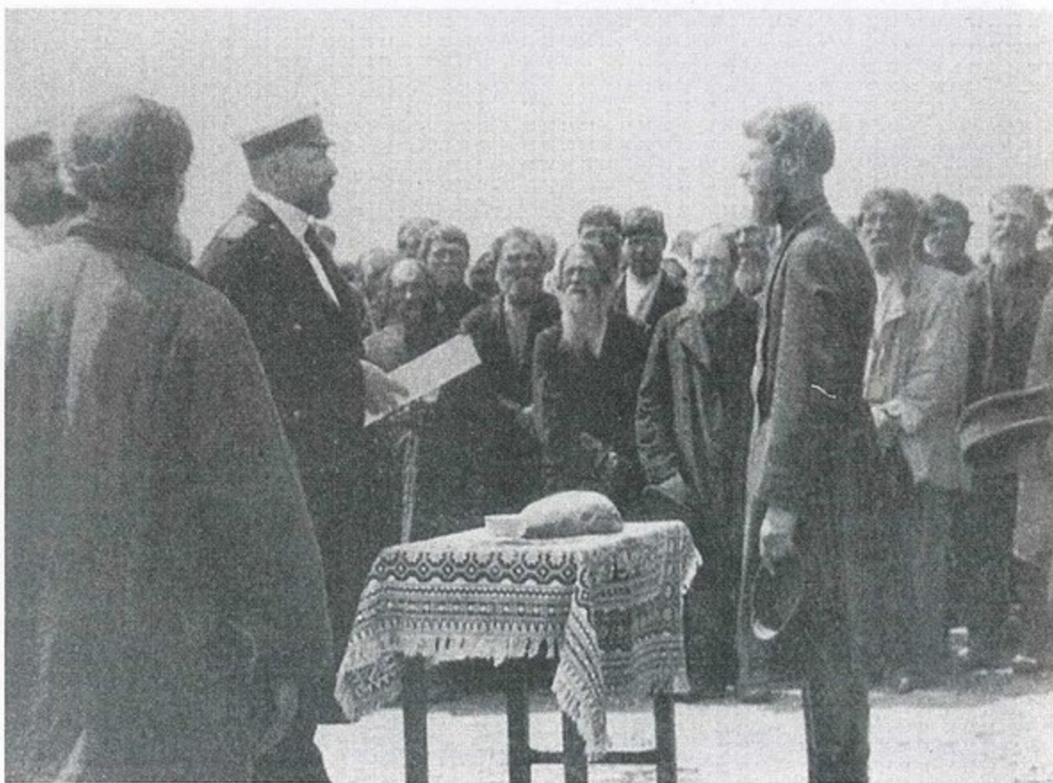
П. А. Столыпин принимает рапорт от волостного старшины в селе Пристанном

время реформ царя-освободителя Александра II. При отмене крепостного права, государство стремилось создать в каждой деревне опору в лице избираемого самими селянами представителя власти. Сельский сход и его исполнительные органы должны были стать «коллективным помещиком». Именно сельский сход в пореформенной деревне вершил всеми делами, принимал решения стратегические: выбирал всех должностных лиц и назначал выборных на волостной сход, «удалял из общества вредных и порочных членов его», принимал новых жителей своего селения, назначал опекунов и попечителей, решал дела, касающиеся общинного пользования землей, раскладывал на крестьян подати и мирские денежные сборы.