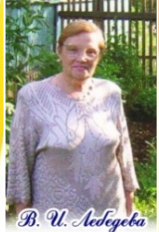
Β. Υ. Νεδυτσα