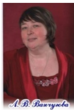
Α. Β. Βανυζτσα

Εραί αυ Ααεαι οει ι αι α Ααι +οαι αα – ι δαι ι αααοαευ εεαηα ι αο+αι ευ εαδυ ι α αι δα, Ϙαααοβυαυ ι αδι αι υι ι οααεαι εαι Ι ΑΙ Ο ΑΙ «Ι ι αι ι δι ανεαυ ααοηεαυ οει εα εηεοηηοα».