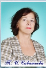
Μ. Υ. Ττκμοτσα

Οαουγί α Ι εει εαααί α Αι ει αει ι αα – αεθαεοί θ Ι ΑΟΕ «Αί ςι αναι ηεεε εθευθοδυ ι -αι ποαί αυε ει ι ι εαειη».